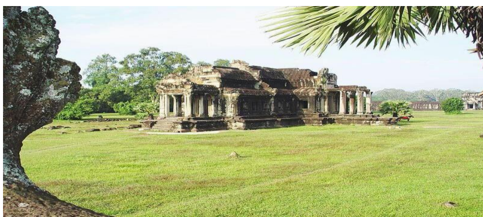
Hao'traye Prassat Angkor

Nota : Angkor Wat accueillait non seulement le temple que l'on connaît, mais aussi les bibliothèques, un palais royal, des bâtiments administratifs, des loges, et d'autres structures aujourd'hui disparues du fait de leur construction en matériaux périssables.