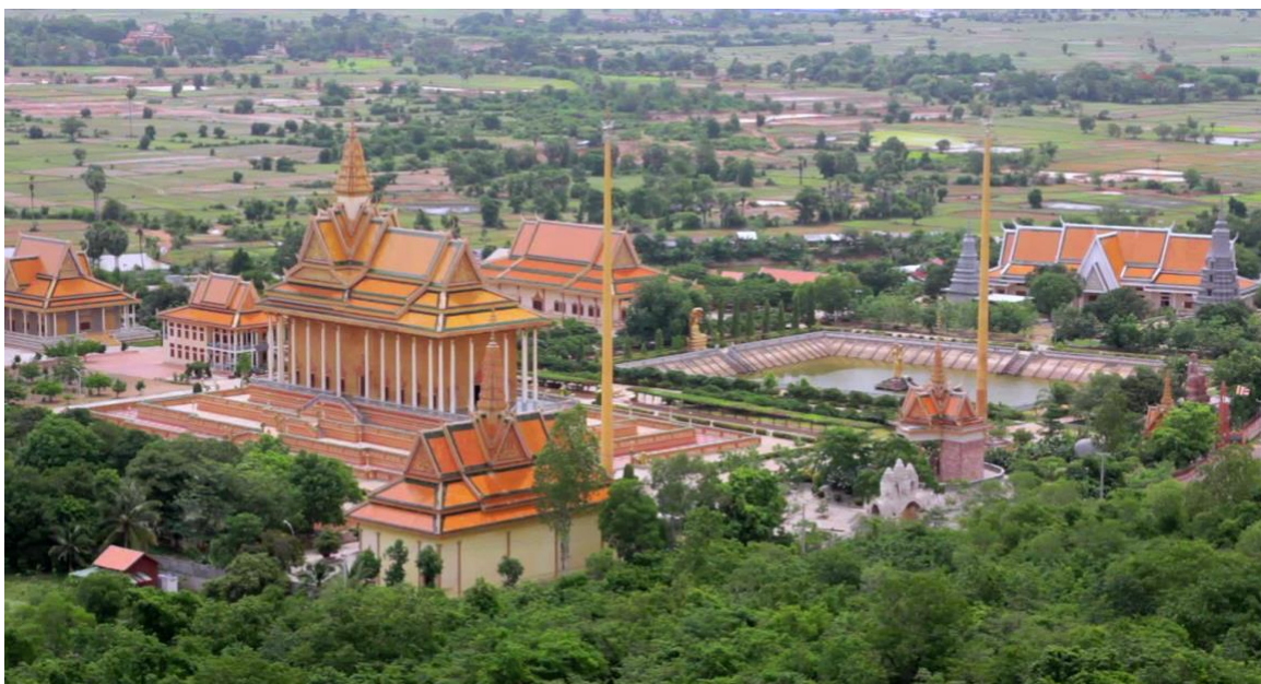
Vue aérienne de la pagode d'Oudon

Car à l'intérieur d'une PAGODE (វត្ត Wat) sont érigés de nombreuses structures, que nous allons découvrir ensemble.