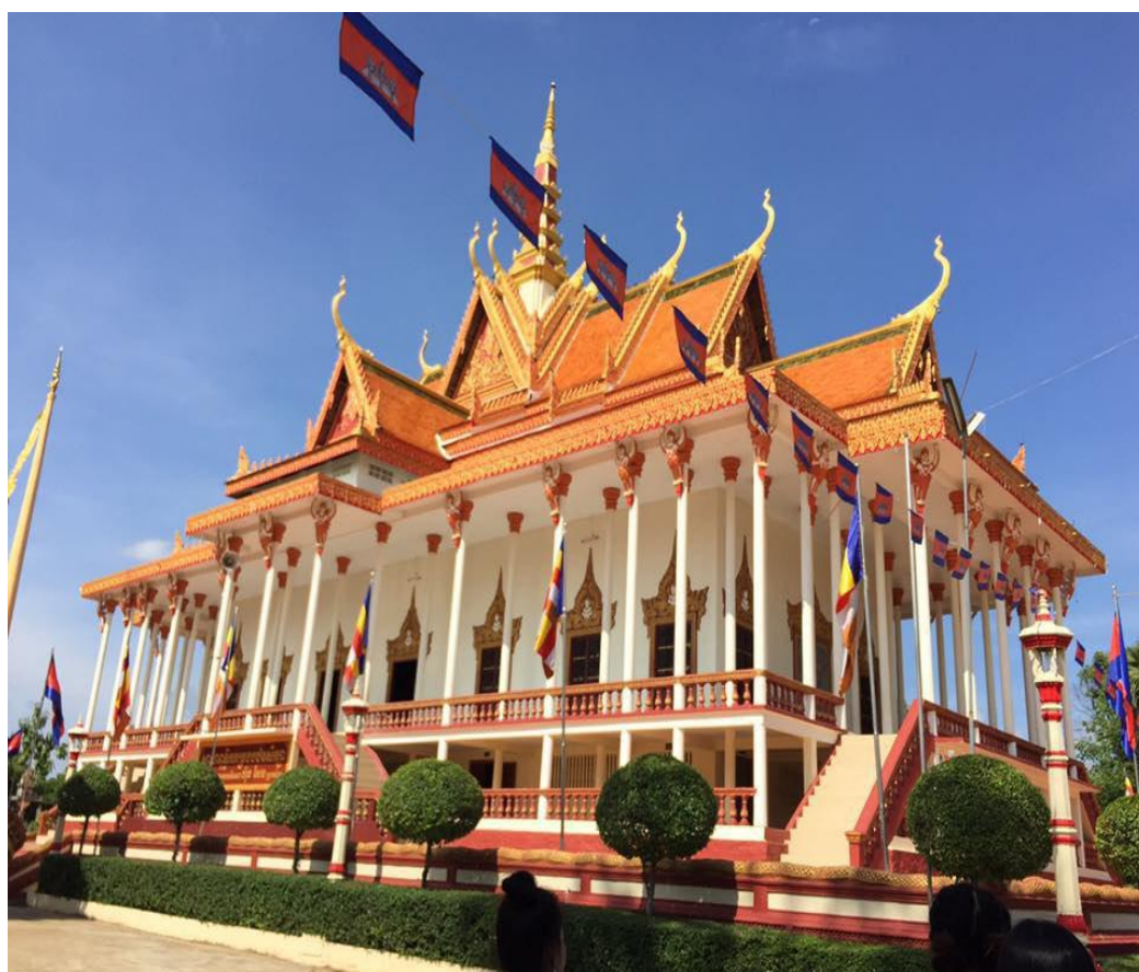
Wi'hir aux 100 colonnes (Wi'hir Sossor Mouye Roye)

Le temple, c'est la fierté de la commune, ou d'un quartier (district). Les riches fidèles font des dons considérables pour obtenir des indulgences et améliorer leur karma.