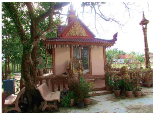
Rrong Lauk Ta / Rrong Lauk Yèye