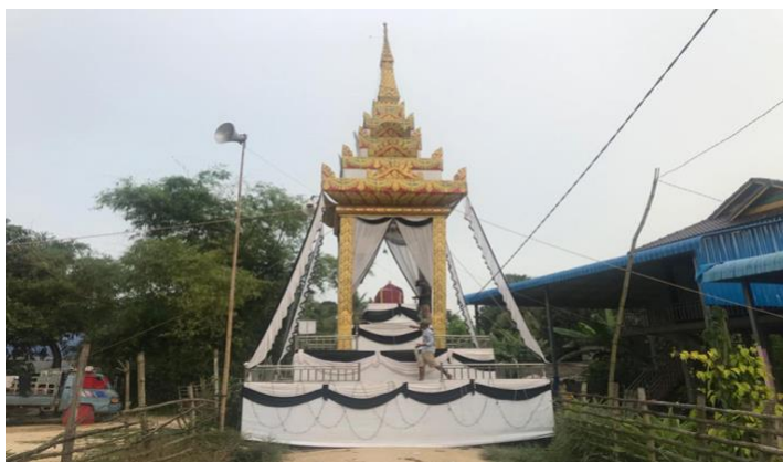
« Méne » traditionnel

De nombreuses familles aisées organisent la cérémonie de crémation en dressant un chapiteau funéraire (appelé " Méne " មេន) devant leur maison, ou à la pagode. La crémation s'effectue de nuit.