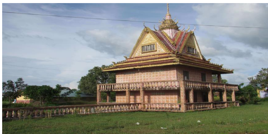
Tiè dèye : Caveau funéraire communale