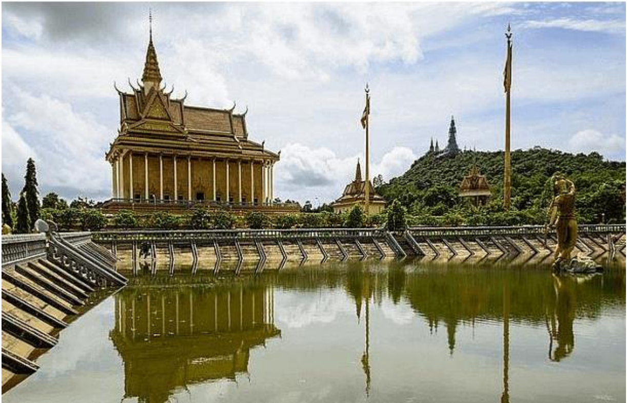
Prassat Oudong & Son plan d'eau

Autrefois, il servait de réservoir d'eau pour la commune, ses abords étaient réalisés en pierre afin de recueillir les eaux de pluies sans que les berges ne ravinent. Maintenant, la tradition de construire un plan d'eau par pagode persiste (lorsque c'est possible).