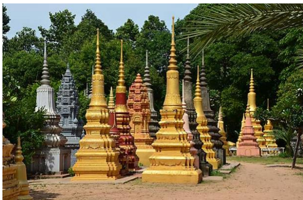
Tiè dèye : Stupas traditionnels

Quelles que soient leurs formes, les Tiè dèye (ចេតិយ) sont des monuments funéraires, incluant le caveau communal (grand oratoire) qui regroupe les urnes funéraires, alignées les unes à côté des autres sur plusieurs niveaux.