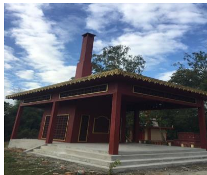
Pä'tcha avec hall

Il faut savoir qu'une personne décédée est considérée comme fantôme dans la culture khmère, c'est la raison pour laquelle, on utilise Dot Kma'oït (ដុតក្មោច) pour désigner la crémation (Brûler le fantôme), même si le terme officiel est Bothir sâpe បូជាសព.