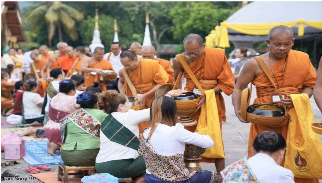
Rroap baat (រាប់ បាត)

Que l'on nomme Lauk sang (លោក សង្ឃ ; langage parlé) ou Prrèr sang (ព្រះសង្ឃ ; littéraire), revêtent un ensemble d'étoffes superposées de couleur safran. Ils ont la tête, le menton et les sourcils rasés. Le rasage s'effectue deux fois sur un cycle de 29 jours. Le jour précédent la Pleine Lune et le jour précédent la Nouvelle Lune. Ce jour est mentionné dans le calendrier lunaire utilisé au Cambodge, il est nommé " Thg'naye Kao " / ថ្ងៃកោរ ( Jour de rasage ), de même sont repérées les jours de : Pleine Lune "Pègne Borromèye" (ពេញបូណ៌មី) ; Nouvelle Lune "Daït Khaè" (ដាច់ខែ).